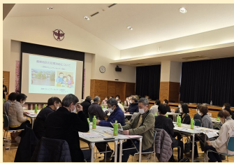
【伊野コミセン交流】

伊野地区も土砂災害警戒区域に民家があり、これまでに4回、避難所開設をされていることからお互いの情報を共有しながら学び合うことができました。