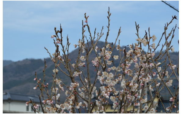
【鳶巣に桜だよりが届きました】