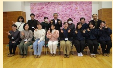
【県大生と未来を語る交流会】

学生から、「鳶ヶ巣地区の人との関わりから人の繋がりの大切さを学んだ」「県立大学周辺にバスの便がなく不便である」などの声が聞かれました。