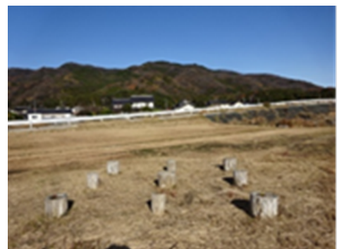
【神社跡の可能性のある建物跡】